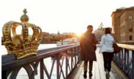
STOCKHOLM Norwegian Air Shuttle 2 x wöchentlich