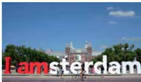
AMSTERDAM Transavia 6 x wöchentlich

Auch im Winter 2014/15 ist Salzburg an drei große Airline-Allianzen angebunden. Mit der Star Alliance, oneworld und dem Skyteam sind ab Salzburg Destinationen auf der ganzen Welt erreichbar. Einen Auszug der reizvollsten Non-Stop-Destinationen ab Salzburg finden Sie auf den folgenden beiden Seiten.