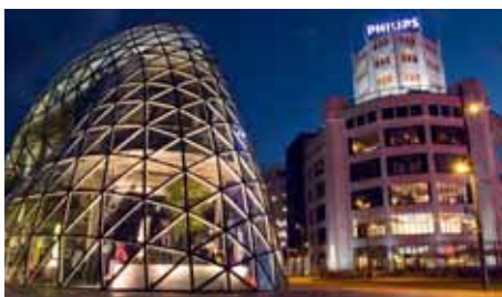
EINDHOVEN Transavia 3 x wöchentlich