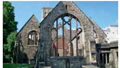
BRISTOL easyJet 1 x wöchentlich