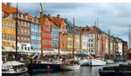
KOPENHAGEN Norwegian Air Shuttle, SAS Scandinavian Airlines, flyNIKI bis zu 3 x wöchentlich