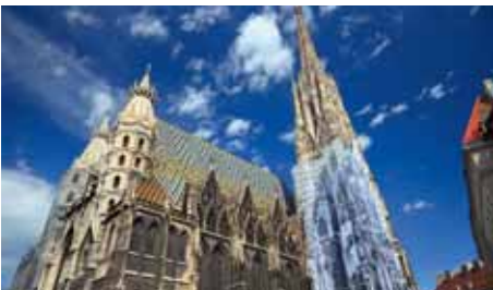
WIEN Austrian Airlines 3 x täglich