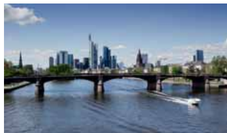
FRANKFURT Lufthansa 4 x täglich