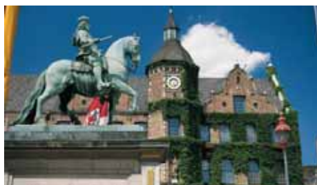
DÜSSELDORF Air Berlin bis zu 3 x täglich