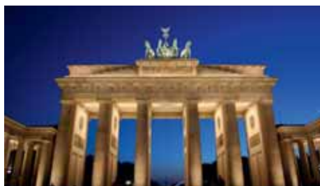
BERLIN Air Berlin, easyJet bis zu 3 x täglich