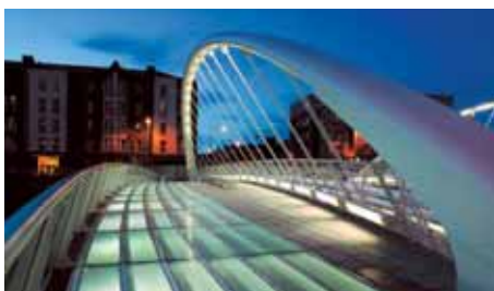
DUBLIN Ryanair 2 x wöchentlich