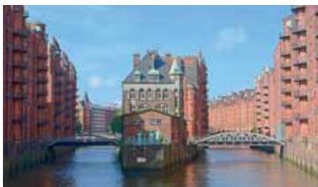
HAMBURG Air Berlin, easyJet bis zu 3 x täglich