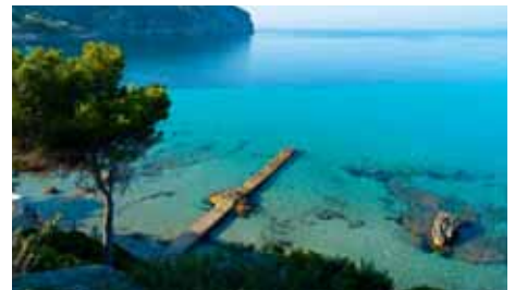
PALMA DE MALLORCA flyNIKI bis zu 3 x wöchentlich