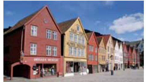
BERGEN Norwegian Air Shuttle 2 x wöchentlich