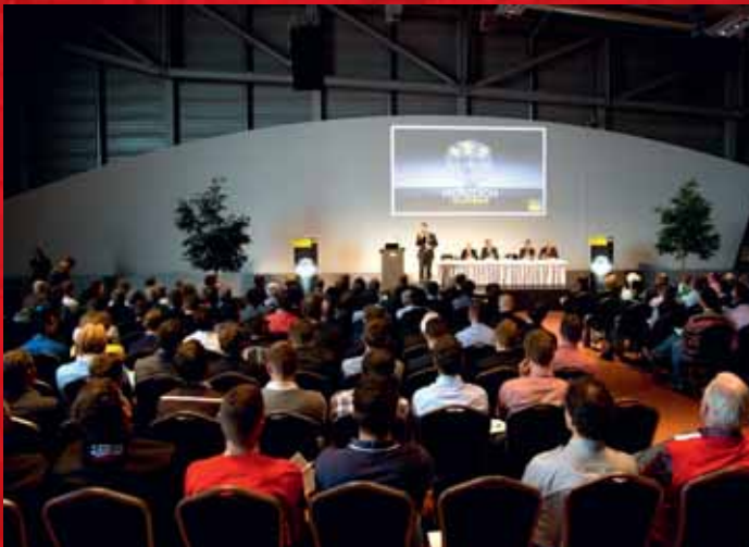
VIEGA SYMPOSIUM | 28. OKTOBER | 250 GÄSTE