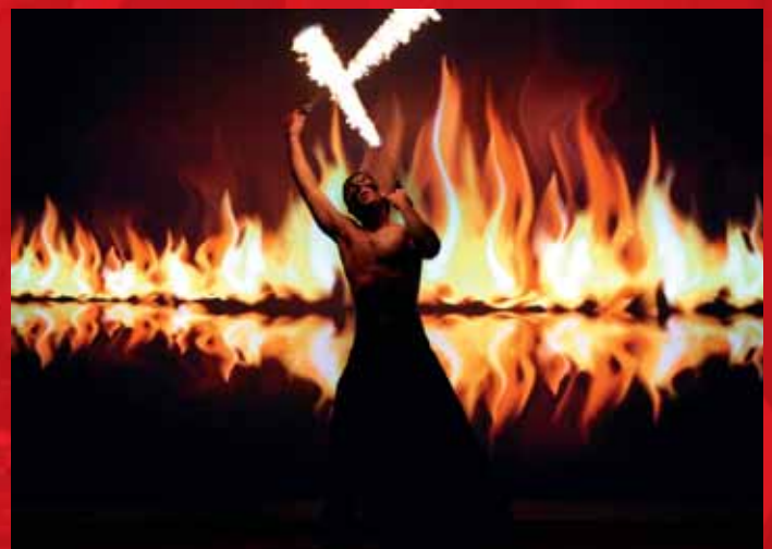
HOGAST-SALESIANER-MIETTEX NIGHT ABENDGALA | 14. OKTOBER | 550 GÄSTE