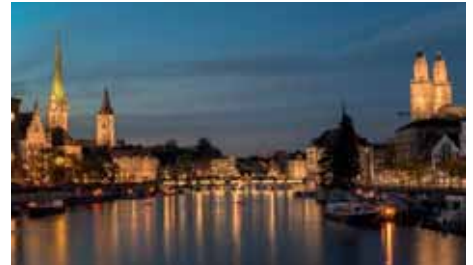
ZÜRICH InterSky 6 x wöchentlich