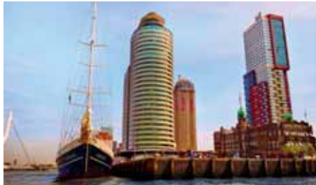
ROTTERDAM Transavia 7 x wöchentlich