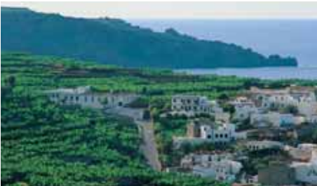
TENERIFFA flyNIKI 1 x wöchentlich