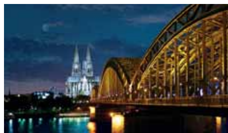
KÖLN Germanwings 6 x wöchentlich