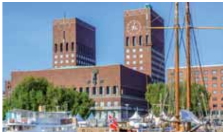
OSLO Norwegian Air Shuttle 2 x wöchentlich