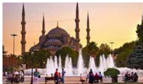
ISTANBUL Turkish Airlines 1 x täglich