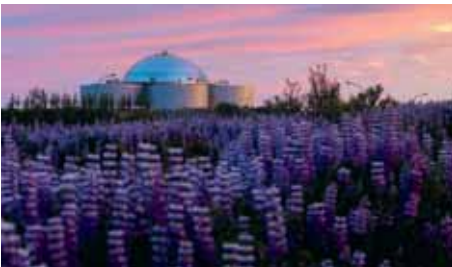
REYKJAVIK WOW Air 1 x wöchentlich