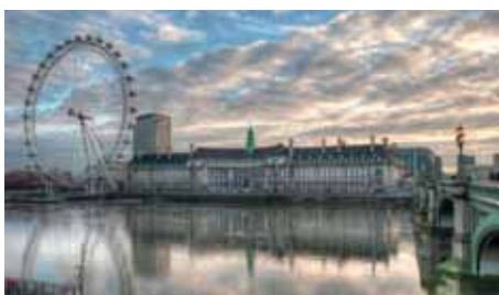
LONDON (Gatwick und Stansted) British Airways, easyJet, Ryanair, Norwegian Air Shuttle, Thomas Cook 19 x wöchentlich