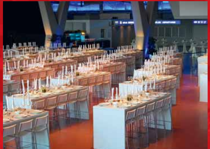
BUNDESVEREINIGUNG DEUTSCHER STAHLRECYCLING- UND ENTSORGUNGSUNTERNEHMEN E. V. ABENDGALA | 18. SEPTEMBER | 400 GÄSTE