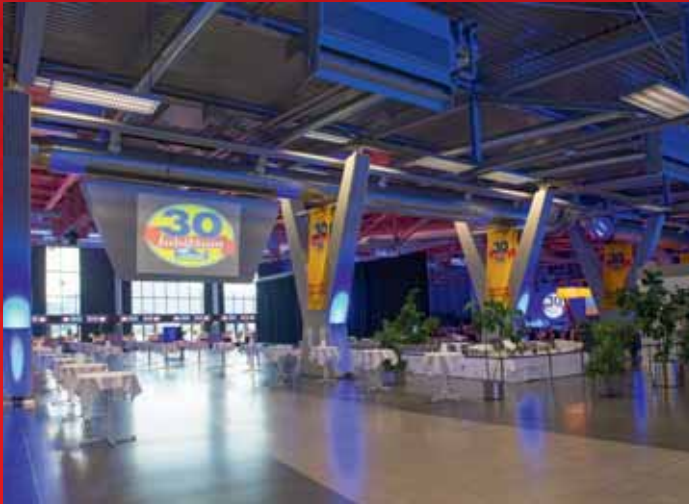
30 JAHRE DÄNISCHES BETTENLAGER ABENDGALA | 25. OKTOBER | 400 GÄSTE