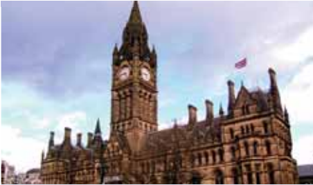
MANCHESTER Thomas Cook, jet2.com 1 x wöchentlich

Informieren Sie sich noch heute unter www.salzburg-airport.com und planen Sie schon jetzt Ihren nächsten Städtetrip oder Urlaub!