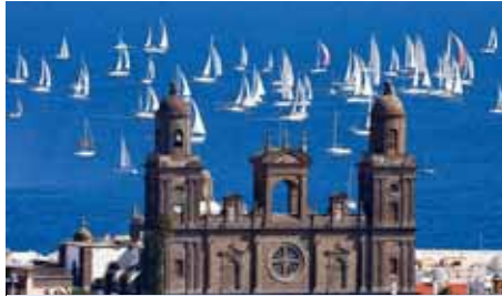
LAS PALMAS flyNIKI 1 x wöchentlich