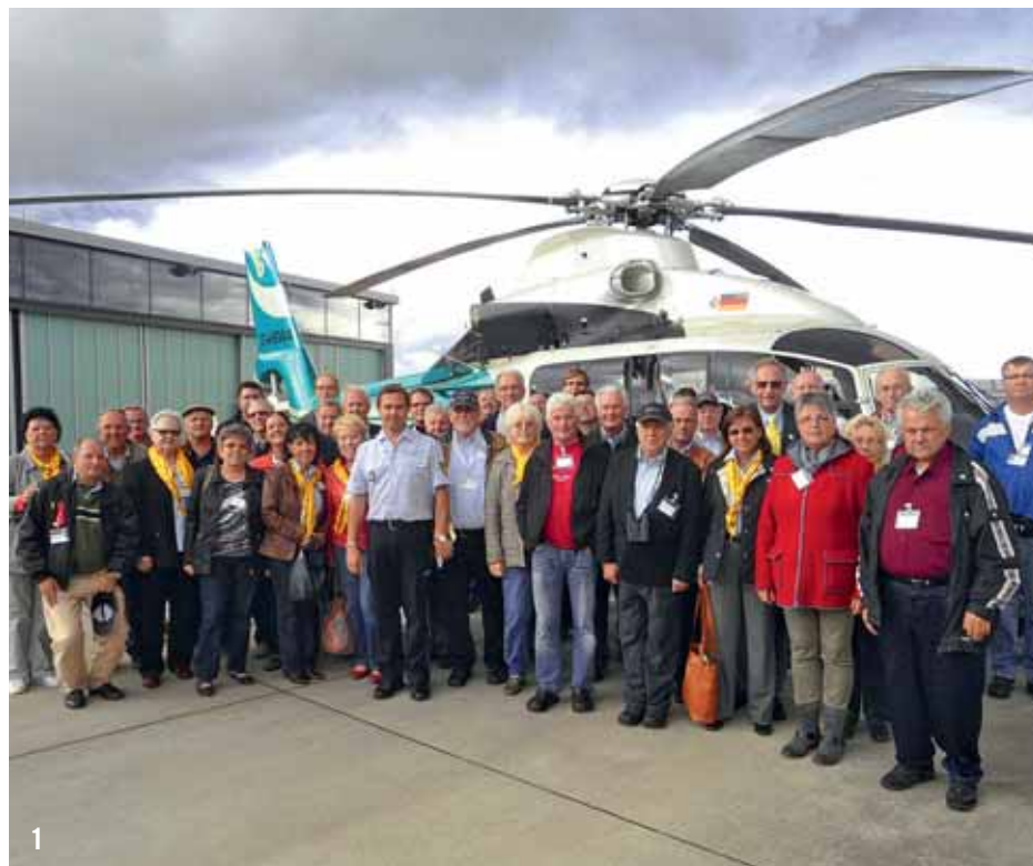
1 Der Clubausflug im Oktober führte den Verein nach Stuttgart und Augsburg.

Außerdem sind wir auch am Familientag (24.12.2014) oder jeden Wintercharter-samstag in der Flughafengastronomie anwesend und beantworten gerne Ihre Fragen!