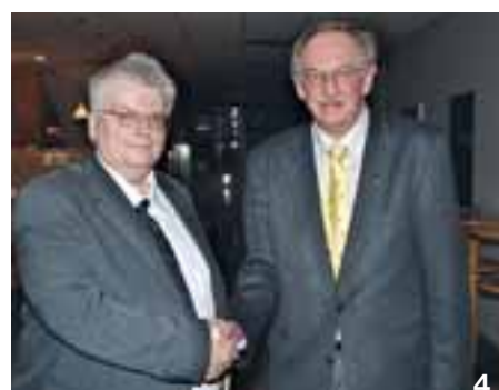
1+2 Voller Einsatz: Unsere Clubmitglieder helfen seit Jahren am traditionellen Familientag mit!