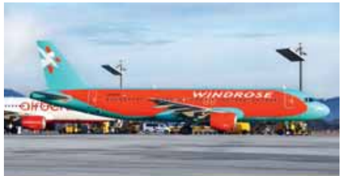
Windrose: Die ukrainische Fluglinie Windrose besuchte Salzburg im Jänner mehrmals mit dem farbenfrohen Airbus A320.