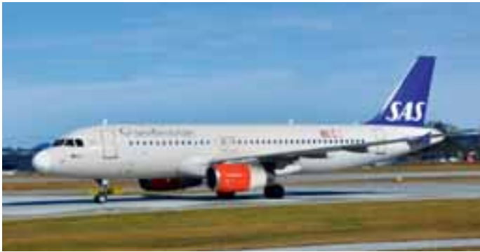
SAS: Scandinavian Airlines ist ein ganzjähriger Gast am Salzburg Airport. Neu ist aber, dass auch ein Airbus A320 eingesetzt wird.