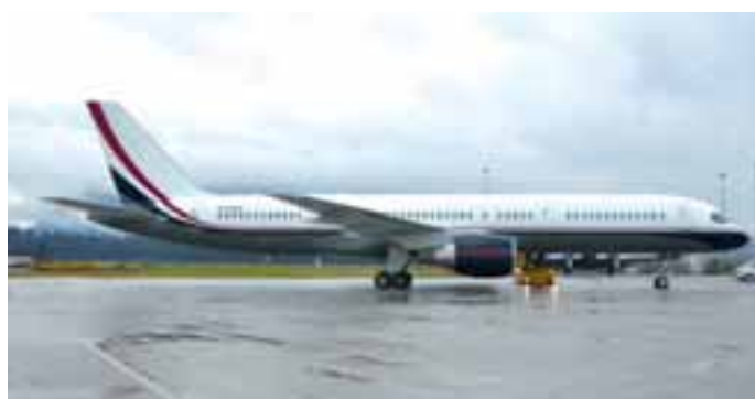
Mid East Jet: Auch größere Privatflugzeuge waren diesen Winter in Salzburg zu sehen. Wie z.B. die saudische Mid East Jet mit einer Bo757-200 Ende Jänner.