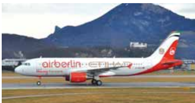
Air Berlin/Etihad: Die Zusammenarbeit von Air Berlin und Etihad wird seit kurzem auf einem eigens bemalten Airbus A320 präsentiert, der in unregelmäßigen Abständen auch in Salzburg zu sehen ist.