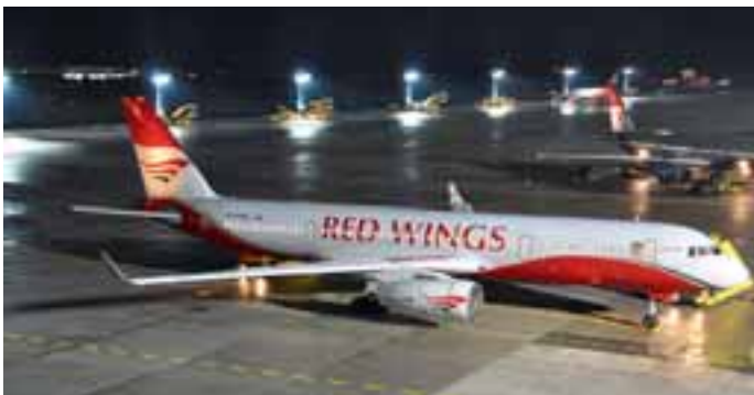
Red Wings: Die russische Fluggesellschaft Red Wings konnte einen großen Reiseveranstalter gewinnen und führte zu den orthodoxen Weihnachtsfeiertagen mehrere Flüge durch.