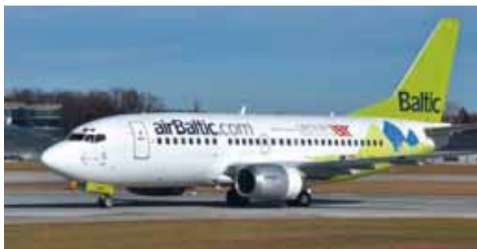
Air Baltic: Die Air Baltic führte erstmals im Winter eine Charterkette durch, im Zuge derer die einzige Bo737-500 mit der Olympia Sonderbemalung in Salzburg zu Gast war.