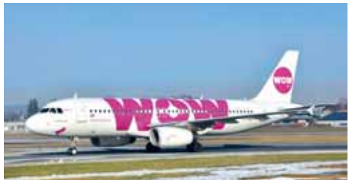
WOW Air: In diesem Winter führte die WOW Air zwischen Reykjavik und Salzburg Linienflüge durch. Dieser auffallende Airbus A320 war jeden Samstag zu Gast.