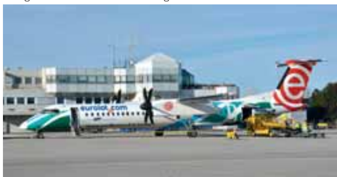
EuroLOT: Mit dieser Sonderlackierung, die für die Region Krakau wirbt, besuchte die Dash 8-400 der polnischen EuroLOT Salzburg.