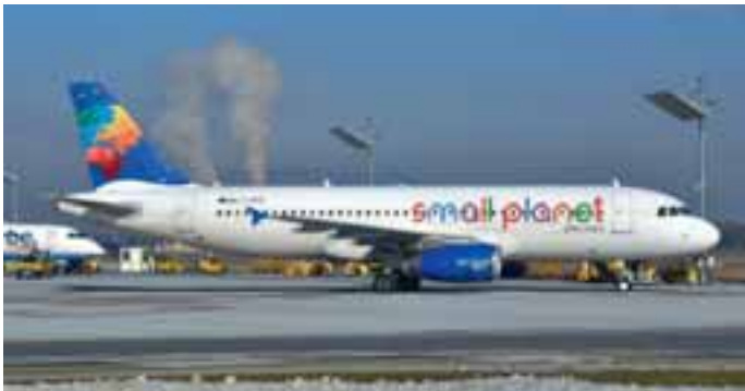
Small Planet: Small Planet flog diesen Winter mit ihrem Airbus A320 eine regelmäßige Verbindung am Samstag nach Vilnius.