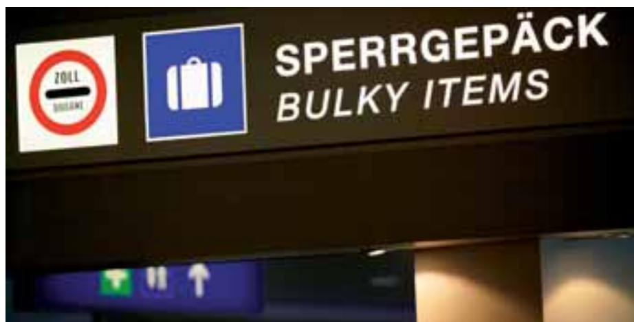
Der Sperrgutschalter am Salzburger Flughafen befindet sich in der Abflughalle, in der Nähe der Check-In-Schalter.

Wenn Sie vom Salzburger Flughafen aus Ihren Flug zum Iron Man nach Hawaii oder zum Golfturnier nach St. Andrews antreten, dann wird Ihr Gepäck am jeweiligen Check-In-Schalter eingechekkt und mit den Baggage Tags gekennzeichnet. Das Sondergepäck muss jedoch vom Passagier im Anschluss zum Sperrgepäckschalter (Bulky Items) gebracht werden. Dieser befindet sich am Salzburger Flughafen ebenfalls in der Abflughalle – gut gekennzeichnet und keine 20 m von den Check-In-Schaltern entfernt. Auf anderen Flughäfen müssen hier mitunter weitere Strecken zurückgelegt werden. Planen Sie daher diese zusätzlichen Wege ein, und informieren Sie sich schon im Vorfeld auf der jeweiligen Internetseite über deren Lage.