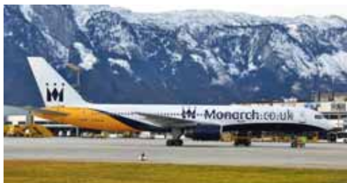
Monarch: Die Monarch Bo757-200 war mit ein paar Sonderflügen im Februar zu Gast in Salzburg.