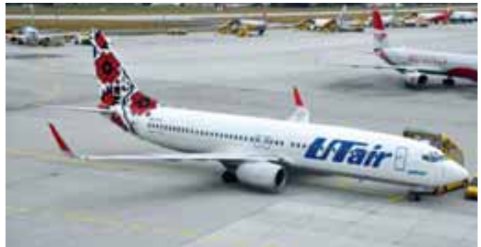
UT Air Ukraine: Der ukrainische Ableger der russischen UT Air kam erstmals mit dieser Bo737-800 nach Salzburg.