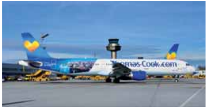
Thomas Cook: Die Thomas Cook Gruppe hat eine neue Bemalung mit herzförmigem Logo eingeführt. Ein Airbus A321 mit einer Mischbemalung und einer zusätzlichen Werbung für Ägypten landete im Winter in Salzburg.