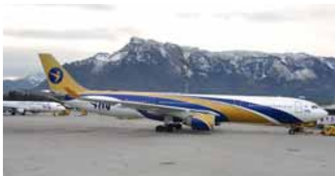
I-Fly: Highlight der heurigen russischen „Weihnachtsflüge“ war Anfang Jänner der Airbus A330-300 der I-Fly. Da dieser in West-Europa nur selten zu sehen ist, war die Freude bei den zahlreich angereisten Fotografen sehr groß.