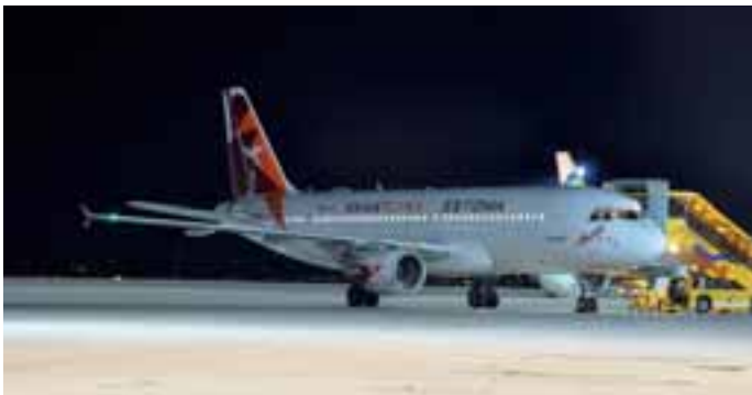
Smart Lynx Estonia: Der Airbus A320 der estnischen Tochter der Smart Lynx konnte in dieser neuen Lackierung am Salzburg Airport empfangen werden.