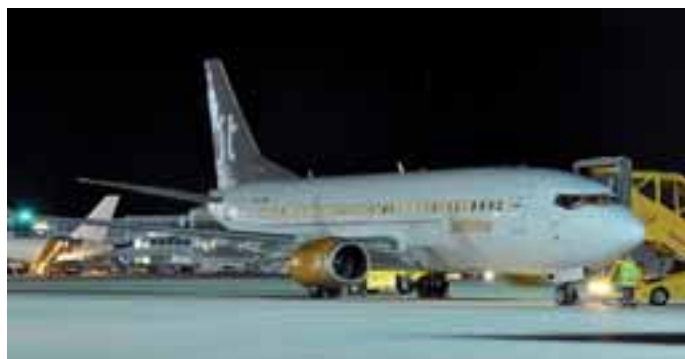
Jetttime: Die dänische Charterairline Jetttime flog in der Wintersaison 2013/2014 mit dieser Boeing Bo737-300 von Kopenhagen und Billund nach Salzburg.