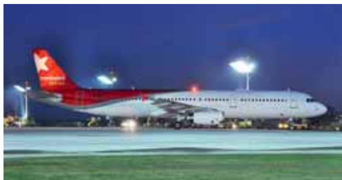
Nordwind: Die russische Fluglinie setzte auf Ihren Flügen nach Salzburg dieses Jahr immer Maschinen des Typs Airbus A321 ein.